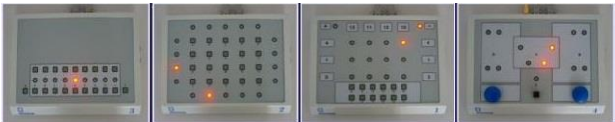
Slika 1. Kompleksni reakciometar Drenovac

Svaki instrument iz CRD serije uključuje testove za procjenu različitih kognitivnih funkcija, od jednostavnih do složenih. Što pojedini test mjeri i njegova simptomatska valjanost utvrđeni su i višestruko provjereni kontinuiranim istraživanjima provedenim na različitim skupinama, uključujući strojovođe, učenike, studente, policajce, menadžere, kadete zrakoplovstva, pilote, dočasnike i časnike kopnene vojske, djelatnike mornarice i druge (49).