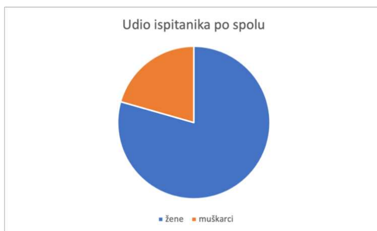
Slika 3. Udio ispitanika po spolu

Gotovo četiri petine ispitanika bilo ženskog spola (n=189), dok je 20,6% ispitanika u istraživanju bilo muškog spola (n=49) (Slika 3).