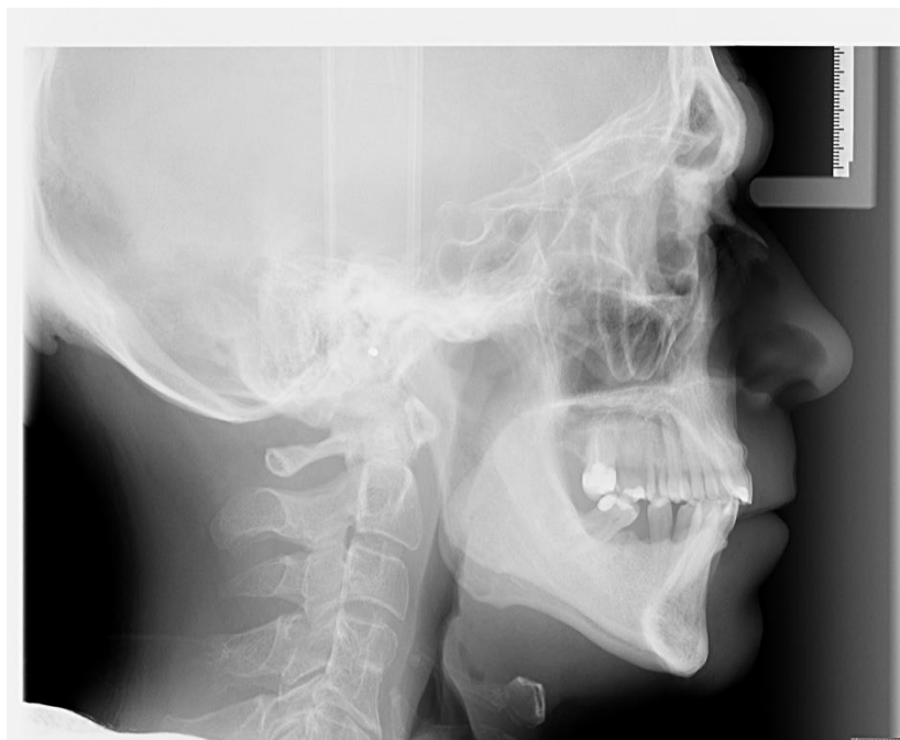
Slika 5. Latero-lateralni rendgenogram glave snimljen bolesniku s OSA-om.

Sve rendgenograme snimio je isti rendgenski tehničar. Tijekom snimanja ispitanici su bili u stojećem stavu, s prirodnim položajem glave, na kraju izdisaja, nisu gutali i sa zubima u maksimalnoj interkuspidaciji.