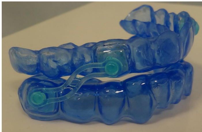
Slika 3. Individualna, prilagodljiva „ custom-made “ udlaga za pomicanje donje čeljusti u prednji položaj Silensor-sl (ERKODENT Erich Kopp GmbH, Pfalzgrafenweiler, Njemačka).

Dentalni kriteriji za korištenje takve udlage su: najmanje 6 do 8 saniranih zubi u svakoj čeljusti, mogućnost neprisilnog pomicanja donje čeljusti prema naprijed za najmanje 5 mm, odsustvo akutne parodontne bolesti i poremećaja temporomandibularnog zgloba (TMZ) (36-38).