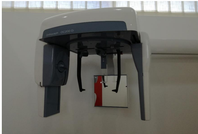
Slika 4. Ortoceph OC200 D – uređaj za snimanje latero-lateralnog rendgenograma glave.

U Centru za dentalnu radiologiju X-Dent u Splitu ispitanicima je snimljen latero-lateralni rendgenogram glave na uređaju Ortoceph OC200 D (Instrumentarium Dental, Tuusula, Finland) u trajanju od 10 sekunda s dozom zračenja od 7,37 mSv, 85 kV i 13 mA (Slika 4, Slika 5).