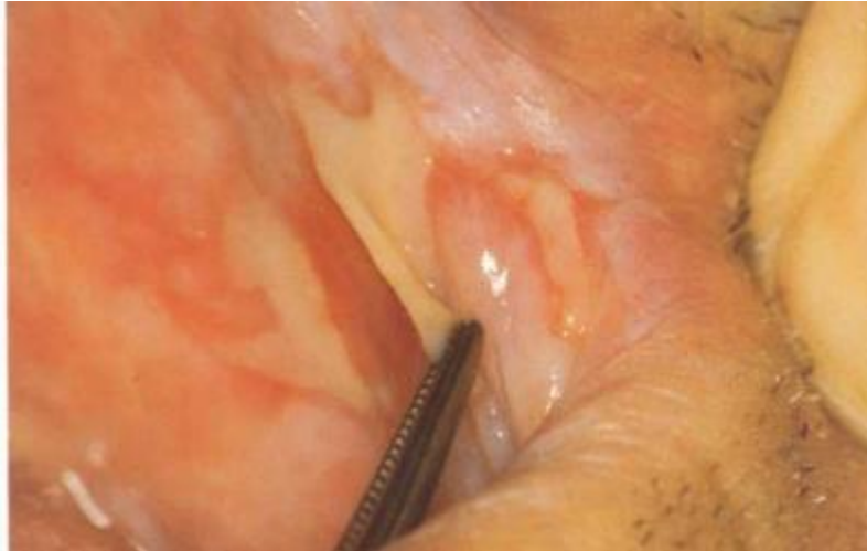
Slika 3. Bulozni oblik OLP-a na obraznoj sluznici.

Preuzeto iz: Laskaris G. Atlas oralnih bolesti. Hrvatsko izdanje. Zagreb: Naklada Slap; 2005.