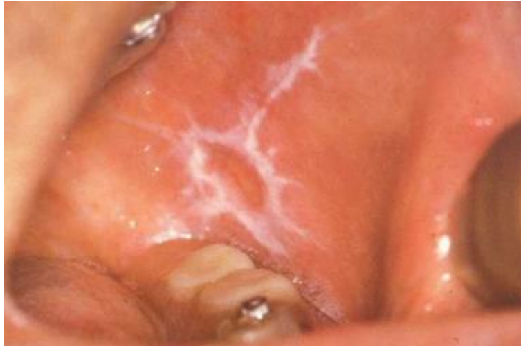
Slika 1. Retikularni oblik OLP-a na obraznoj sluznici.