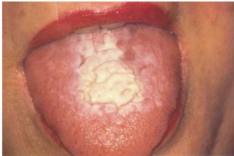
Slika 2. Plakozni oblik OLP-a na dorzumu jezika.

Preuzeto iz : Laskaris G. Atlas oralnih bolesti. Hrvatsko izdanje. Zagreb: Naklada Slap; 2005.