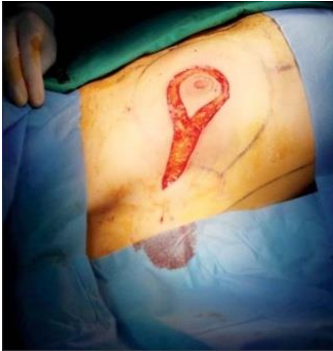
Slika 3. Incizija kod mastektomije s poštedom kože

Supkutanom mastektomijom uklanja se tkivo dojke uz poštedu kože, ali i areole i bradavice.