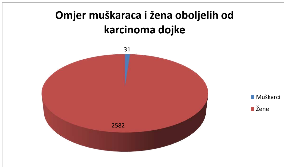
Slika 5. Grafički prikaz omjera muškaraca i žena oboljelih od karcinoma dojke u RH u 2017. godini.

U istraživanje je uključeno 2613 bolesnika sa dijagnosticiranim karcinomom dojke u Republici Hrvatskoj u razdoblju od 01. 01. 2017. do 31. 12. 2017. godine. Od ukupnog broja oboljelih bilo je 2582 (98,8%) žena i 31 (1,2%) muškarac. Prosječna životna dob bolesnika bila je 63 godine (raspon 24 – 95 godina).