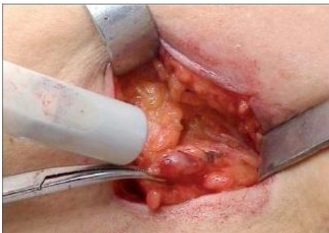
Slika 4. Biopsija sentinel limfnog čvora

Kod klinički negativne aksile indicirana je biopsija sentinel limfnog čvora (limfnog čvora "stražara") (Slika 9) (7). Desetak minuta prije kirurškog zahvata uštrca se radioaktivni koloid i/ili plava boja u kožu iznad tumora. Nakon navedenog vremena detektira se vrući limfni čvor radiodetektorom (1). Ako su pozitivna više od dva limfna čvora potrebna je disekcija aksile. Disekcija aksile, koja uključuje minimalno deset limfnih čvorova radi se nakon neuspjeha diferenciranja sentinel limfnog čvora te nakon provedene neoadjuvantne terapije (7).