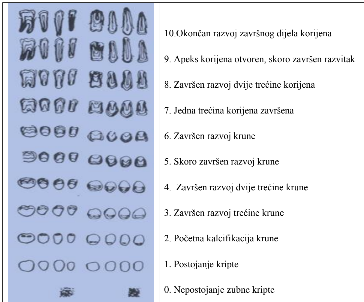
Slika 3. Stadiji razvoja mandibularnih i maksilarnih zuba. Preuzeto i prilagođeno prema (15).

Sukladno izvornom članku, Nolla metode su osmišljene tako da se mogu provoditi na dva različita načina (15). Jedan od njih uključuje sve gornje i donje zube jedne strane lica, ali ne uključuje treće kutnjake i to je NOL7 metoda, dok drugi uključuje sve zube kao i kod metode NOL7, ali i treće kutnjake ili NOL8 metoda. Ove metode se koriste za promatranje i identifikaciju stadija mineralizacije zubi na temelju referentne tablice. Kod ove metode su se nakon klasifikacije svakog zuba, faze zbrajale te su se rezultati promatrali prema referentnoj tablici za procjenu dentalne dobi (15). Nolla metode (sa i bez trećih kutnjaka) se smatraju subjektivnim metodama.