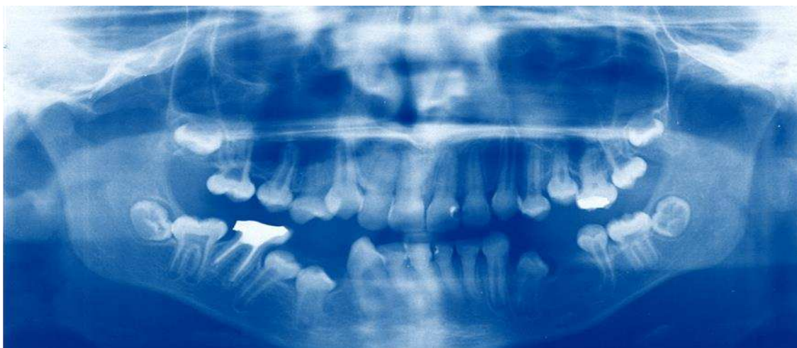
Slika 4. Ortopantomogram.

U svrhu ovog istraživanja su korištene radiografske snimke svih zubi na kojima se mogu vidjeti obje čeljusti i okolne strukture, poput maksilarnih sinusa i čeljusnih zglobova (Slika 1.). Rentgenske snimke koje su korištene u ovom istraživanju su dobivene iz arhiva Zavoda za dentalnu antropologiju Stomatološkog fakulteta Sveučilišta u Zagrebu. Veći dio snimki koje su analizirane, u svrhu ovog istraživanja, bio je u digitalnom obliku, ali jedan manji dio njih bio je i u analognom obliku.