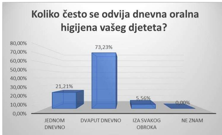
Slika 5. Raspodjela roditelja s obzirom na stavove roditelja o dnevnoj potrebi četkanja zubi.

Na Slici 5 prikazana je raspodjela roditelja s obzirom na stavove roditelja o dnevnoj potrebi četkanja zubi.