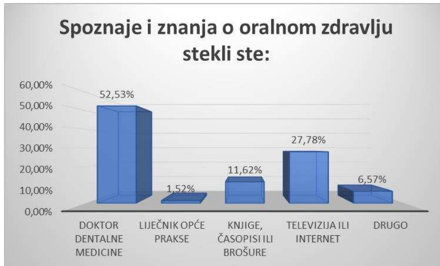
Slika 7. Raspodjela roditelja s obzirom na način stjecanja znanja roditelja o oralnom zdravljju.

Na Slici 7 nalaze se podaci o načinu stjecanja znanja roditelja oralnom zdravljju.