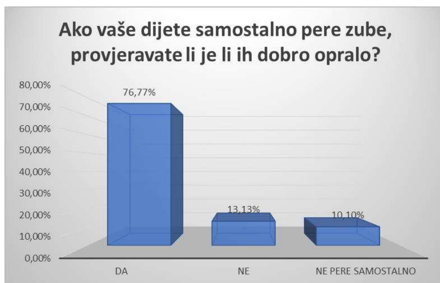
Slika 6. Raspodjela roditelja s obzirom na stavove o načinu kontrole pravilnog četkanja zubi djeteta.

Na Slici 6 prikazani su podaci o navikama roditelja o načinu kontrole pravilnog četkanja zubi.