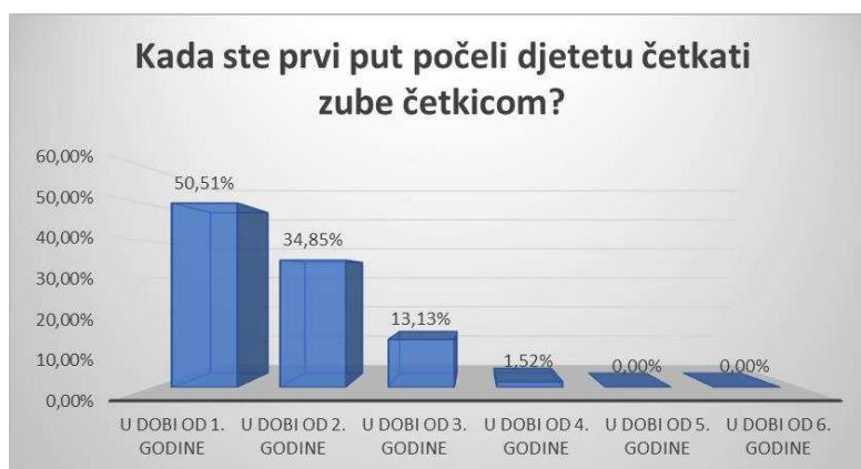
Slika 4. Raspodjela roditelja s obzirom na navike o početku četkanja zubi djeteta.

Na Slici 4 prikazani su podaci o navikama roditelja o početku četkanja zubi djeteta.