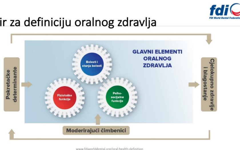
Slika 1. Okvir za definiciju oralnog zdravlja. Preuzeto i prilagođeno iz (3).

Kako nije moguće definirati oralno zdravlje samo jednom rečenicom, FDI definirala je i dodatna obilježja kojima bi objasnili višечimbenični pristup oralnom zdravlju u kojima objašnjava da je oralno zdravlje osnova fizičkog i mentalnog zdravlja te da nema roka trajnosti, a pod utjecajem je iskustva, percepcije, očekivanja te sposobnosti pojedinca da se prilagodi na novonastale situacije (Slika 2).