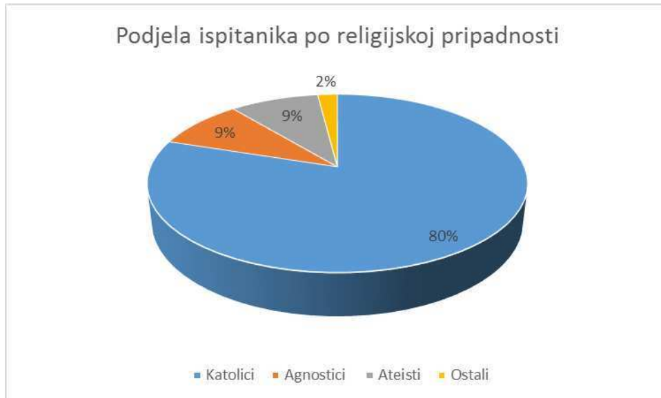
Slika 3. Prikaz ispitanika po religijskoj pripadnosti

Među ispitanicama je bilo 75% onih koji nisu bili u prethodnom kontaktu s psihijatrijskim pacijentom i 25% koji su bili u kontaktu s psihijatrijskim pacijentom prije nastave iz psihijatrije (Slika 4).