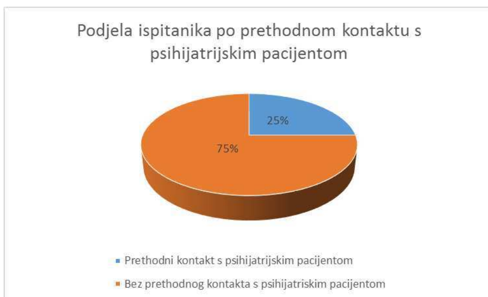
Slika 4. Prikaz ispitanika po prethodnom kontaktu s psihijatrijskim pacijentom

Među ispitanicama je bilo 75% onih koji nisu bili u prethodnom kontaktu s psihijatrijskim pacijentom i 25% koji su bili u kontaktu s psihijatrijskim pacijentom prije nastave iz psihijatrije (Slika 4).