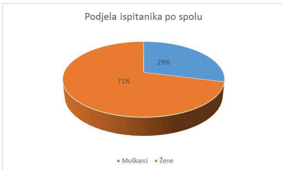
Slika 1. Prikaz ispitanika po spolu

Dob svih ispitanika bila je između 21-25 godina (Slika 2).