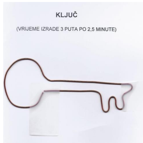
Slika 2. Ključ. Preuzeto iz (14).

Drugim testom, kojim se provjerava ručna brzina i vještina, ispituje se brzina popunjavanja ploče s 10 x 10 rupica metalnim čavličima. Kandidat dominantnom rukom uzima dva čavlića i nastoji redom što učinkovitije popuniti rupice. Bodovi se dobivaju na temelju brzine i učinkovitosti popunjenih rupica (Slika 3) (15).