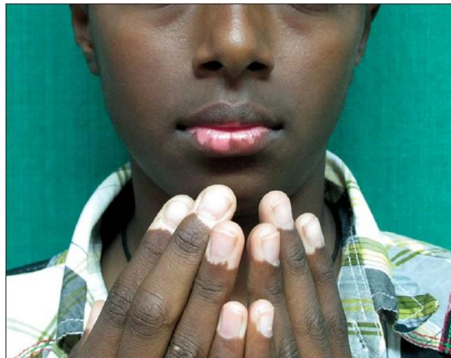
Slika 3. Akrofacijalni oblik vitiliga.

Postoji fokalni oblik vitiliga u kojem se pojavljuje izolirana bijela makula bez segmentalne distribucije. Može napredovati u segmentalni ili nesegmentalni oblik. Opisan je i mukozni oblik vitiliga kod kojeg je zahvaćena samo jedna sluznica (49).