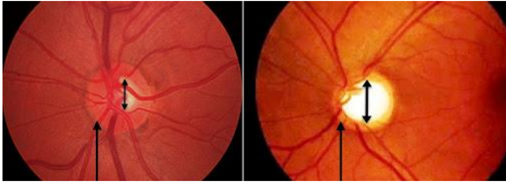
Slika 2. Usporedba normalne i glaukomatozno oštećene papile vidnog živa.