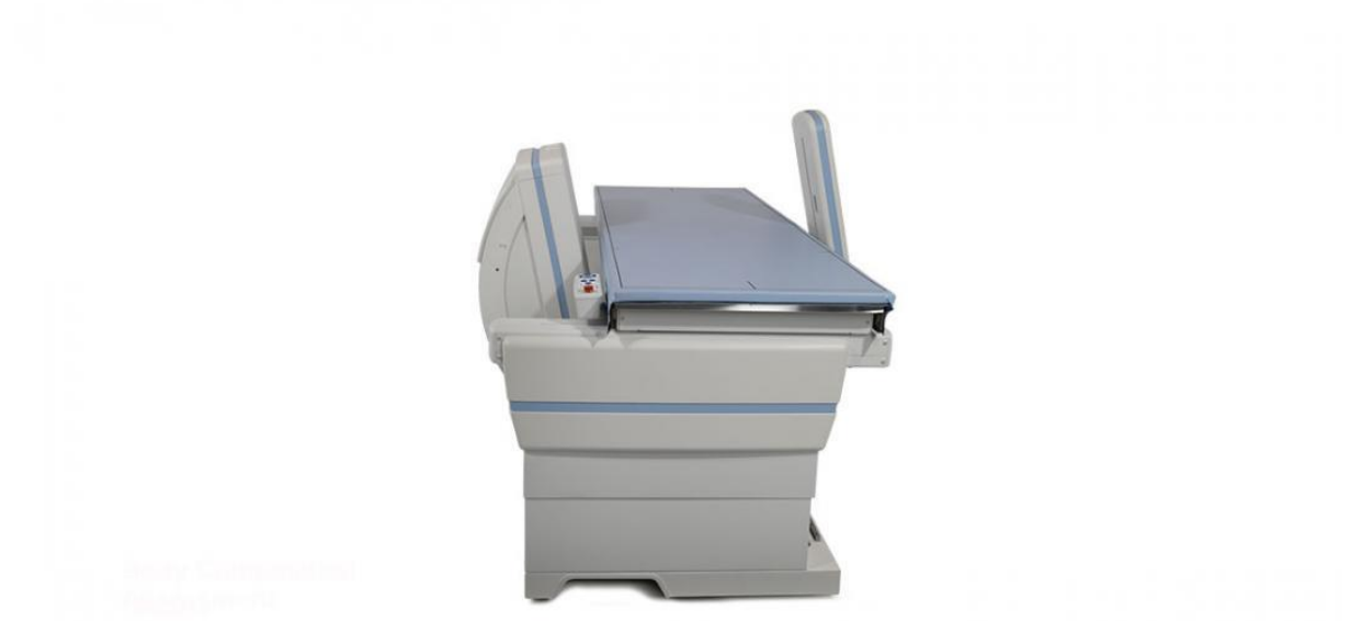
Slika 1. Uređaj za mjerenje mineralne gustoće kosti dvoenergetskom apsorpciometrijom.

kralježnice, kuka i vrata bedrene kosti, a moguće je mjerenje i u području podlaktice, petne kosti i cijelog tijela (18).